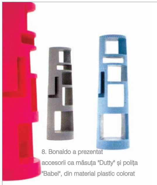
8. Bonaldo a prezentat accesorii ca măsuța "Dutty" și polița "Babel", din material plastic colorat