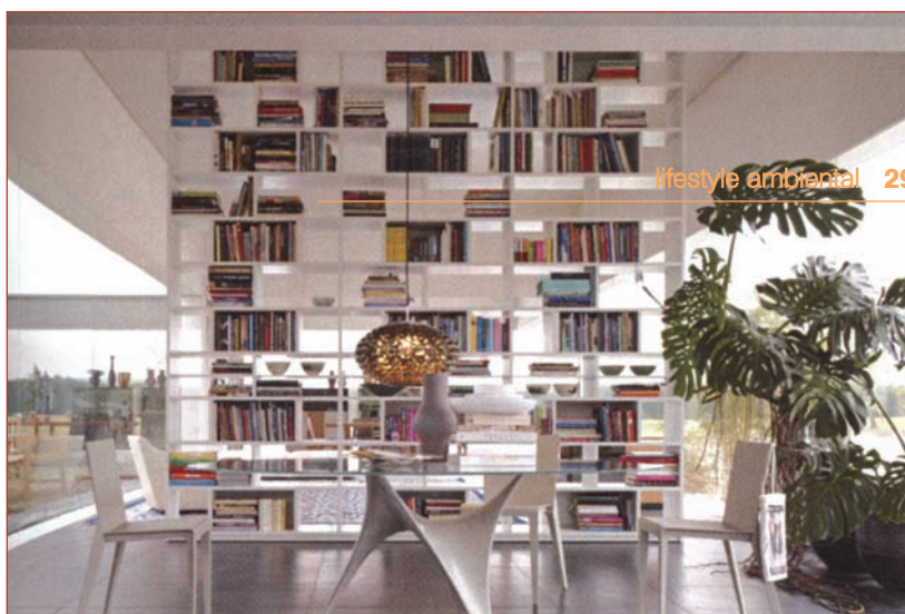
2. Masa "Arc" de la Molteni, cu picioarele din compozit de beton, imită o stea de mare

biblioteca să ofere cărțile spre citire dintr-un unghi întotdeauna potrivit.