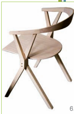
6. Scaunul lui Konstantin Grcic poate fi înșiruit prin stivuire orizontală, grație blatului rabatabil (producător BD Barcelona)