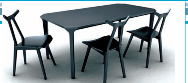
8. Scaunul "Nara" amintește de creatorul japonez Shin Azumi (producător: Fredericia)

formelor, mărturisește despre creatorul japonez Shin Azumi. Deși maniera italiană influențează puternic cultura interioară a locuințelor la cumpăna dintre milenii, totuși paralel și în completarea acestuia apar și caracteristici particulare ale tendințelor naționale. Prin design, valoarea adăugată obiectelor crește în mod real, reprezentând o spiritualitate care determină o devalorizare mai grea.